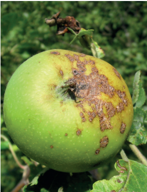
Apfelschorf ( Venturia ), Pilzerkrankung