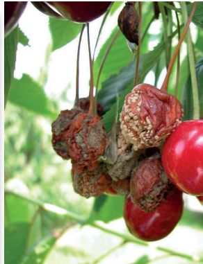
Fruchtfäule ( Monilia ), Pilzerkrankung