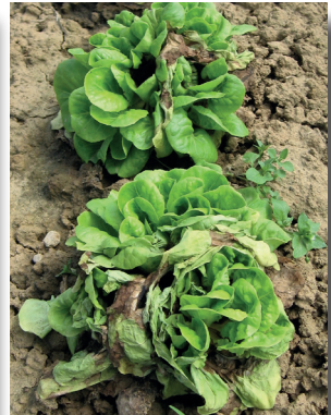
Schwarzfäule ( Rhizoctonia ), Pilzerkrankung